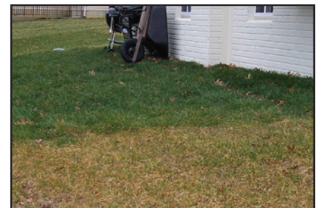
Black Beauty sod holds up in poor soils of low pH where lesser tall fescue sod and seeding jobs fail.