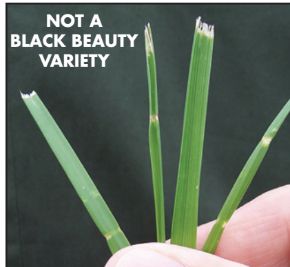
Mower Damage on regular Tall Fescues. Black Beauty will not shred or tear.

◀ The waxy coating on the grass leaf is like the wax on an apple, which preserves the moisture in the plant and wards off disease.