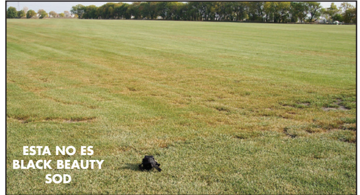
Black Beauty no obtiene enfermedades oxidas como Kentucky Bluegrass.