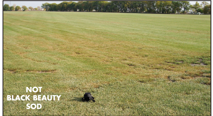
Black Beauty doesn't get rust diseases like Kentucky Bluegrass.