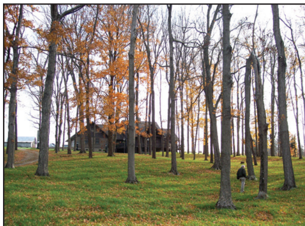
Black Beauty is very shade tolerant and performs even better than fine fescues in fertile soil.