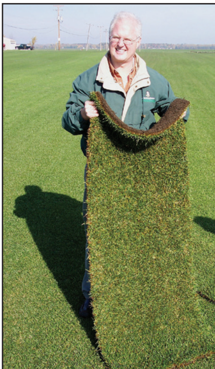
Black Beauty Sod mixed with 10% Kentucky Bluegrass won't tear when handled at one year old. This sod contains no netting.