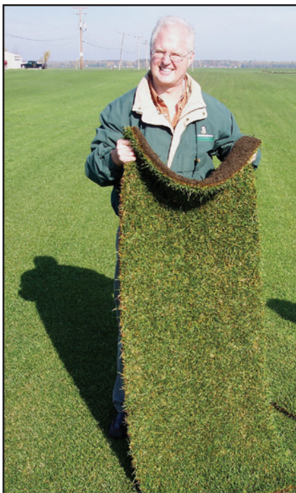
Black Beauty mezclada con 10% de Kentucky Bluegrass no sedegara cuando se maneja en el año de haber crecido. No contiene malla.